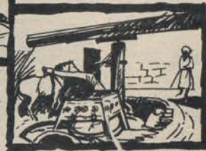
MULINO ARABO →

DOVE SCARSE ERANO LE ACQUE CORRENTI, MA FREQUENTE IL VENTO, I MULINI VENNERO DOTATI DI BRACCIA E DI VELE, CAPACI DI SOTTRARRE AL VENTO L'ENERGIA UTILE A COMPIERE LA FATICA INVECE DELL'UOMO.