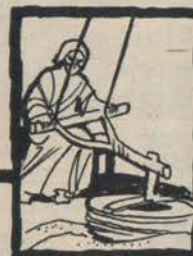
MULINO A MANO DELLA CINA ←