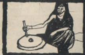
MULINO A MANO DEGLI UADI-SCIATI