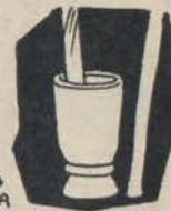
MORTAIO → DEI BATONGA