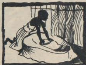
MACINA DEGLI ZULU'